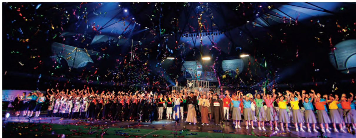
鹿児島大会総合開会式グランドフィナーレ