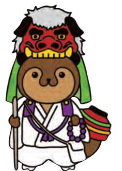
大会マスコットキャラクター「さぬぼん」