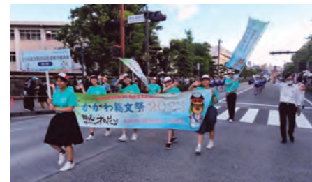
鹿児島大会パレードに参加