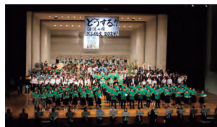
岐阜プレ大会総合開会式に参加