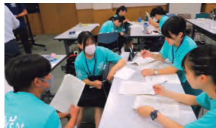
生徒実行委員会での協議