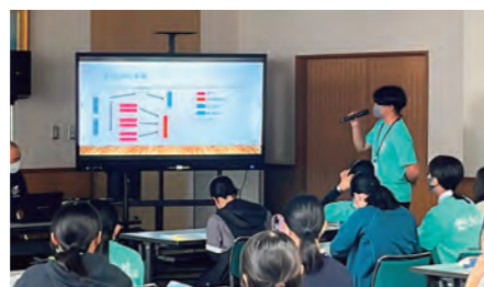
岐阜プレ大会参加報告