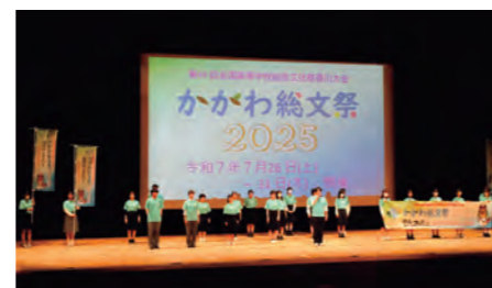
県総文祭総合開会式ステージ発表