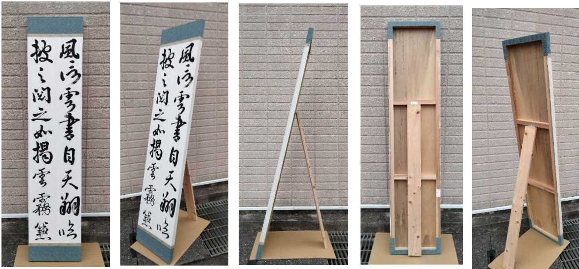
【作品パネルの作製イメージ (写真)】