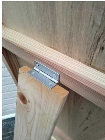
【共同作品のイメージ (写真)】